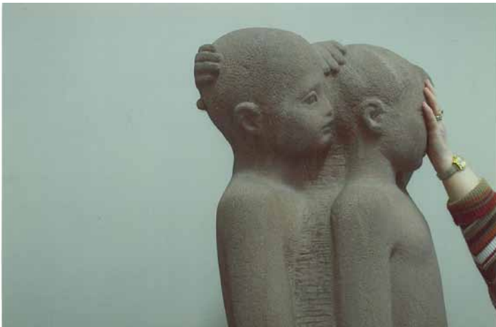
La photo montre un visiteur posant sa main sur une des sculptures du Musée