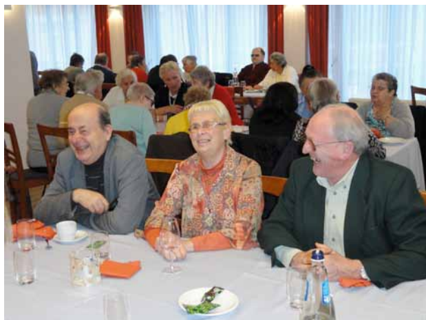
la photo montre quelques volontaires de l'ONA

« C'est une leçon de vie ! De voir la joie des bénéficiaires et de pouvoir compter sur eux lors des activités organisées, cela me touche. Je redécouvre ainsi des valeurs essentielles. »