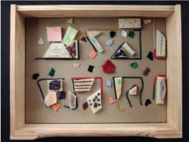
EXPOSITION « LE FILM À TOUCHER », UNE IMAGE D'UNE TABLE TACTILE

La première du film « Mer emporte en demi-sommeil et train sauvage » a eu lieu ce jeudi 22 septembre 2011 à la Maison des Cultures et de la Cohésion Sociale de Molenbeek. Ce film est issu d'un atelier, entre janvier et juin 2011, créé autour de la notion de sensation et puisé dans l'univers du rêve de ses créateurs au travers de créations plastiques animées et de compositions électroacoustiques. La soirée a permis de découvrir le fruit de cet atelier et de pouvoir échanger avec le public, les participants et les animateurs. Le public a pu également décou-