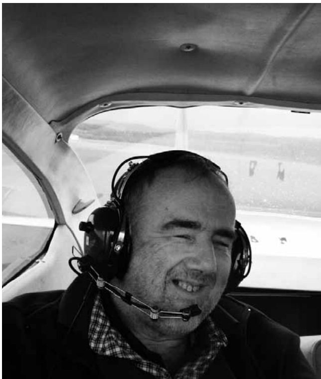
UN PARTICIPANT À LA JOURNÉE BOL-D'AIR DE L'ASBL AIR-LOISIRS À SAINT-HUBERT

Vous avez répondu très nombreux à nos activités d'été 2011 et nous en sommes très heureux. Détente, activité sportive, visite culturelle ou simplement retrouvailles conviviales autour d'une bonne table... Le menu était varié. Il a attiré plus de 250 participants, bravo ! Il faut dire qu'avec le temps maussade que nous avons connu tout l'été, il y avait bien des motifs d'envie de sortir et se distraire. Cela commençait par un tournoi de pétanque adapté dans le cadre de la 3 ème édition « Noctamboule » organisée au complexe sportif de Libramont. Dans le déroulement de ce tournoi, une place était réservée aux personnes déficientes visuelles et c'est à l'ONA qu'avait été confiée l'organisation pratique de cette activité. Après avoir été admirablement conseillés par le cercle sportif HA.VI. La Louvière et son sympathique