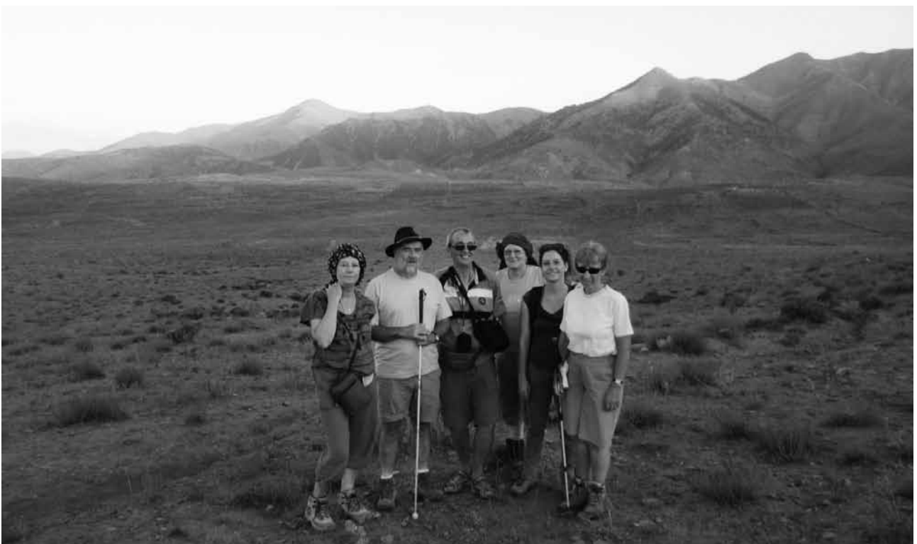
LE GROUPE DEVANT LE MAGNIFIQUE PAYSAGE DU HAUT ATLAS MAROCAIN