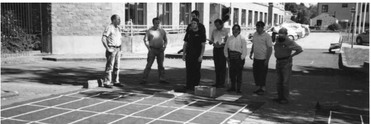
LE TAPIS DE JEU DE PÉTANQUE ADAPTÉ PAR L'ONA

Enfin, c'est à Libramont, autour d'un cochon à la broche que nous terminions cet été. Encore une fois le soleil a bien voulu nous accompagner toute la journée. Tout était installé dès 9 heures du matin. Et oui, pour cuire 45 kg de viande sous les braises... ça prend un peu de temps ! Mais quel délice ! Au lieu de la sieste après le repas, nous avons proposé une démonstration de pétanque adaptée. Tous ceux qui s'y sont essayé (bien-voyants comme déficients visuels sur un pied d'égalité grâce aux lunettes occultantes) ont apprécié : ce n'est que vers 18 h que les parties se sont terminées. Bravo aux vainqueurs et à tous les participants. Merci surtout au compteur des points, finalement c'est lui qui avait le plus de « travail » ! Voilà, c'est terminé pour cette année, merci à tous d'avoir participé. Sans aucun doute nous renouvellerons l'expérience l'année prochaine.