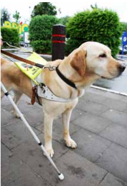
UN CHIEN GUIDE EN PLEIN TRAVAIL

peut aussi être un repère de la déficience visuelle. Il s'agit de mouvements rythmiques des globes oculaires horizontaux et parfois verticaux ou rotatoires. Pour utiliser son résidu visuel, une personne peut aussi incliner la tête pour mieux regarder. Souvent, le contact visuel lors d'une discussion est rendu difficile et perturbe les habitudes de communication non verbale, à savoir par exemple se regarder dans les yeux.