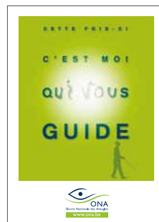
LA COUVERTURE DU NOUVEAU DÉPLIANT DE SENSIBILISATION ONA