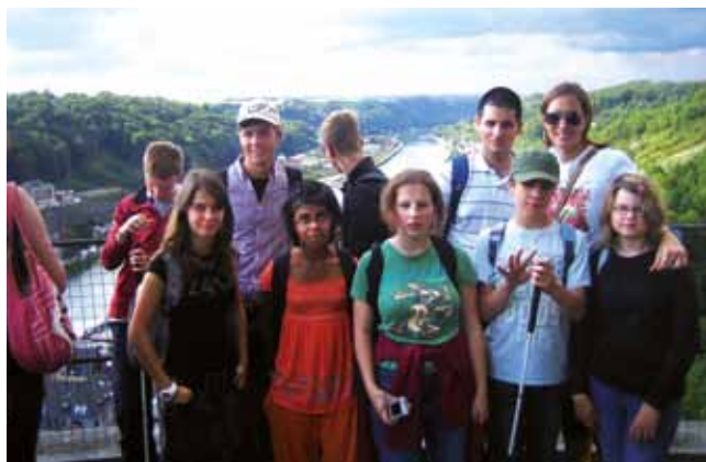
LE GROUPE DEVANT LA BEAUTÉ DU PAYSAGE DE LA VALLÉE DE LA MEUSE

« L'activité que j'ai bien aimé c'est la visite de la Maison de la Pataphonie. Il y avait différentes façons de faire de la musique, avec des couverts, des tuyaux, des billes ... Nous avons aussi fait une activité Top chef ; nous avons été jugés sur trois zakouskis, un plat et un dessert. Nous avons dansé de la country avec de vrais professeurs ! Je pense que tout le groupe a apprécié ce séjour. J'ai trouvé qu'il y avait une superbe ambiance avec beaucoup de joie et de bonheur. »