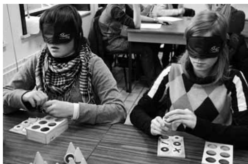
DEUX JEUNES JOUENT À DES JEUX ADAPTÉS AVEC UN BANDEAU

Nous vous en parlons déjà dans les éditions précédentes du VLL, le service communication a créé, grâce au soutien de la Ville de Bruxelles, une valise pédagogique « Découvertes autour de la déficience visuelle et gestes de rencontre et d'accompagnement » pour les adolescents de 15 à 18 ans. Cette réserve d'outils est dès à présent mise à disposition de leurs professeurs, animateurs ou éducateurs moyennant une caution de 100 euros remise au retour de