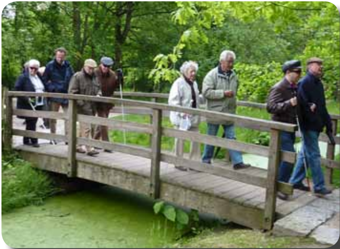
Découverte du parc

Cela fait dix ans en effet, que chaque année, le Rotary club de Bruxelles-Forêt de Soignes organise pour les membres de l'ONA une découverte des espaces naturels de Bruxelles et environs. Après le Rouge-Cloître, le parc du Karreveld, le parc Tournay Solvay, le parc d'Enghien, le bois du Laerbeek, le Scheutbos... le dernier en date fut le parc de la Héronnière qui s'étend longitudinalement, telle une coulée verte et bleue, à la limite de Watermael-Boitsfort et d'Auderghem.