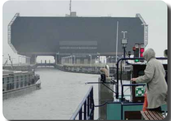
Vue de l'ascenseur

justement ce passage du bac, puis le retour en petit train, ce qui ne nous a nullement empêchés de rester béats d'admiration devant ce prodige des ingénieurs de notre pays.