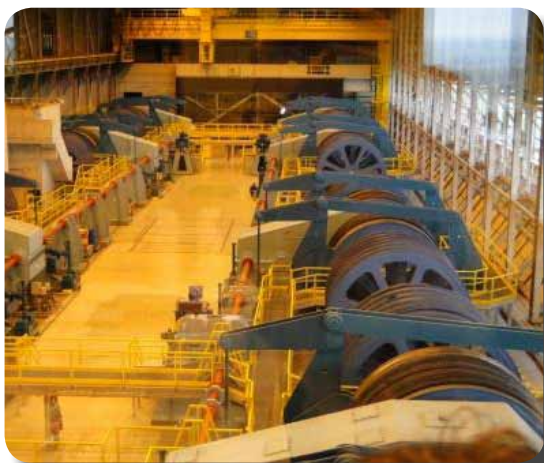
La salle des machines